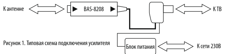
Рисунок 1. Типовая схема подключения усилителя

Примечания: В вашем усилителе могут быть изменения, не отмеченные в настоящем паспорте и не ухудшающие его параметры.