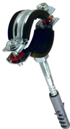
Хомут металлорезиновый СТМ

Изготовитель: «Sanitary Technic Machinery Co., Ltd», 138, West Zhongshan road, Haishu, Ningbo, Китай.